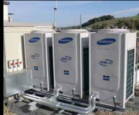
Außeneinheiten einer Multisplitklimaanlage

Haben Sie zu warme Büroräume, Hallen, Server-, Technik-, Labor-, Rein- oder Messräume? Kein Problem, denn egal ob einzelne Räume, ganze Stockwerke oder Gebäude - mit unseren Lösungen zur professionellen Raumkühlung sind Ihre Räume immer bestens und kostengünstig klimatisiert.