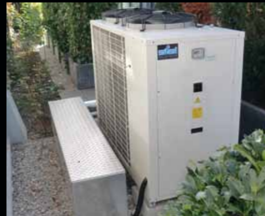
Kaltwassersatz im Außenbereich aufgestellt

Wir bieten Ihnen ein hochwertiges und breitgefächertes Produktprogramm im Bereich Kaltwasser (5 - 1.000 kW, luft- oder wassergekühlt) zur Innen- oder Außenaufstellung. Für Ihren Einsatzzweck haben wir die energieoptimierte Lösung.